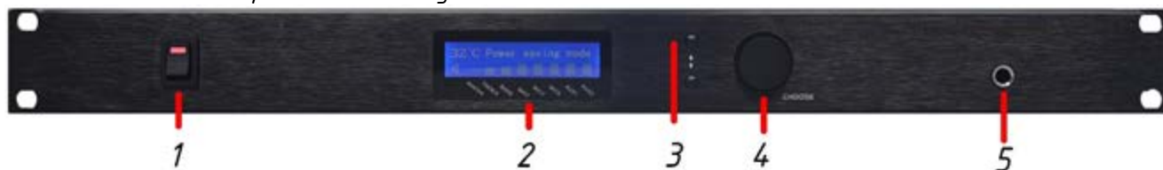
Рис.2.2. Передняя панель усилителя мощности LPA-8508NASP06