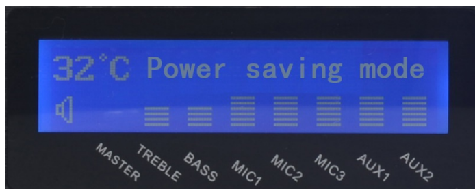
Рис.5.1. Начальный экран LPA-8508NASP06

Первоначальный экран имеет вид как на рис. 5.1: